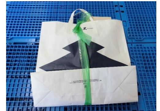
ひもでしばって出す