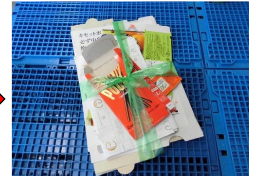
束ねてひもでしばって出す