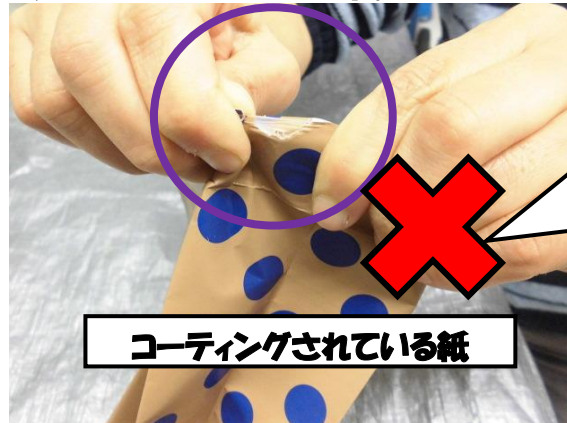
コーティングされている紙

※コーティングされた紙は資源になりません。その他にも資源にならない紙がありますので、ご注意ください。