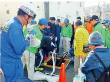
スタンドパイプ取扱訓練

「自分たちのまちは自分たちで守る」という防災意識の高揚と災害に強いまちづくりの推進が図られた。 大地震発生初動時の対応訓練を地域住民と防災関係機関が一体となって実施したことによって、 「自分たちのまちは自分たちで守る」という防災意識の高揚と災害に強いまちづくりの推進が図られた。 訓練ができた。 大地震発生初動時の対応訓練を地域住民と防災関係機関が一体となって実施したことによって、 訓練ができた。 大地震発生初動時の対応訓練を地域住民と防災関係機関が一体となって実施したことによって、 訓練ができた。