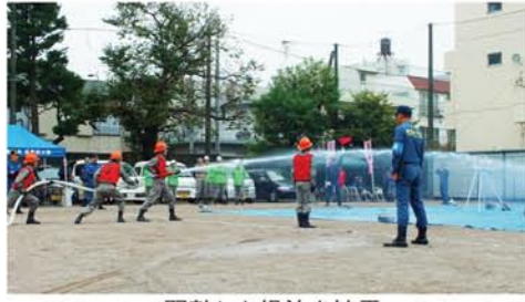
習熟した操法を披露

区民消火隊ポンプ操法大会 10月30日(日)、板橋フレンドセンター敷地において、区民消火隊によるC級ポンプの操法大会(主催:板橋区、協賛:板橋・志村消防署、同消防団、板橋区町会連合会)が開催された。 区民消火隊は、避難道路沿いの住民防災組織を中心に40隊が配置され、震災時には避難道路周辺などの火災を早期に鎮圧するという役割を担っており、日頃から迅速で安全確実なポンプ操法を身につけるための訓練を重ねている。 今大会には20隊が出場