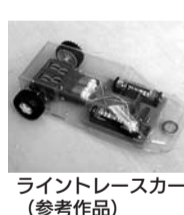
ライントレースカー(参考作品)

央・城北職業能力開発センター板橋校(舟渡2ノ2ノ1) 対象 小学4年~6年生 ※初日は保護者同伴 定員 20人(申込順) 費用 無料 共催 都立中央・城北職業能力開発センター板橋校 申込・問 6月16日(月)朝9時から、電話で産業振興課産業就労係 3579-2172