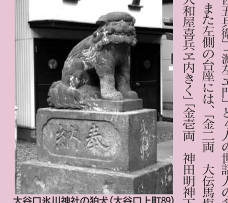
大谷口氷川神社の狛犬(大谷口上町89)

この金額は、現在の石像彫刻物の価格と大差はありません。しかし、当時の生活水準からすると、実際には何倍もの価値がありました。しかも当時は、飢饉などによって諸物価が高騰しており、商売をしているとはいえず、気軽に出来る金額ではなかったはず。それにもかかわらず、彼らは、どうして当社に狛犬を奉納したのでしょうか。親しんだ故郷の氏神様への信心からだったと思われ、故郷に錦を飾ろうという思いがなかったとは言い切れません。しかし、今となっては、それをあきらかにする術がないのが残念です。