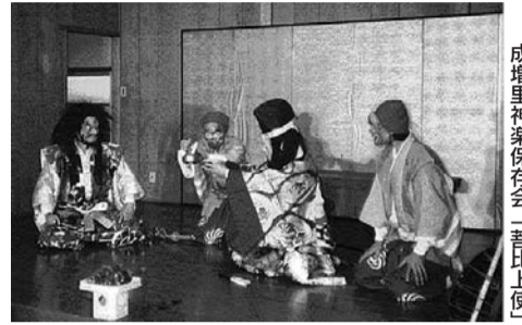
成増里神楽保存会「善比上使」

区指定無形民俗文化財「里神楽」を保存・伝承している、成増里神楽保存会の公演を行います。