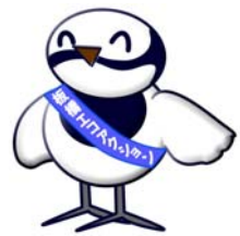
環境保全課のマスコットハクセキレイの「ハクちゃん」です。