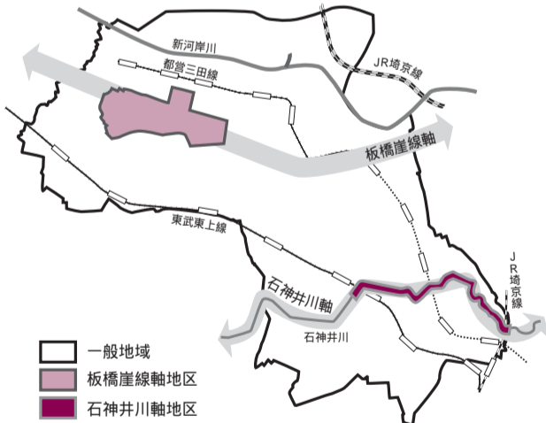
《届出対象行為・規模と景観形成のための基準》