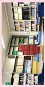
① 閲覧室・事務室 ②～⑥の資料の取扱い、この部屋にある「目録」をご利用ください。職員が資料をお持ちします。