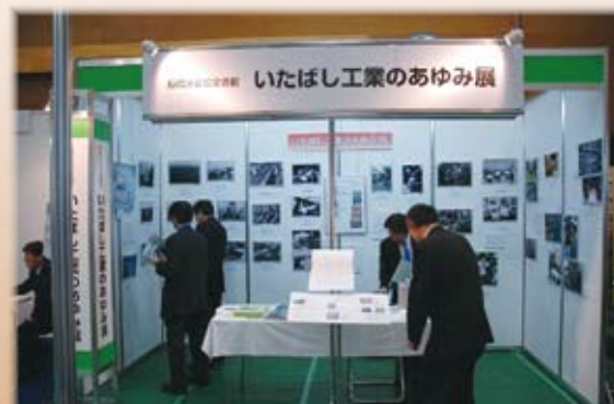
企画展「いたばし工業のあゆみ展」 (2会場にて)