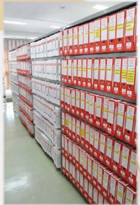
書架に整然と並ぶ アーカイブボックス