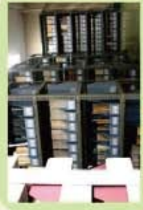
⑤ 櫻井徳太郎文庫 2

交通機関： 新三田線「板橋本町駅」下車徒歩7分 東武東上線「中板橋駅」下車徒歩20分 国際興業バス「大和町」下車徒歩7分 「上野」下車徒歩7分