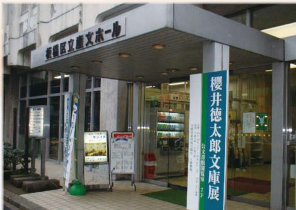
旧公文書館入り口（旧産文ホール）