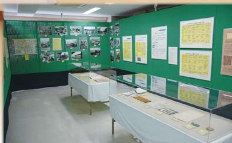
企画展「未来は過去の中にある！ ザ・公文書館」