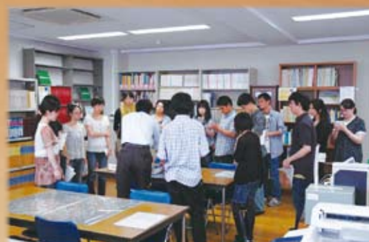
大学生による見学会のようす