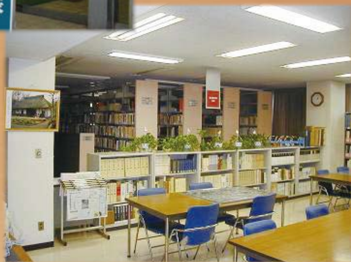
旧公文書館閲覧室（旧産文ホール）