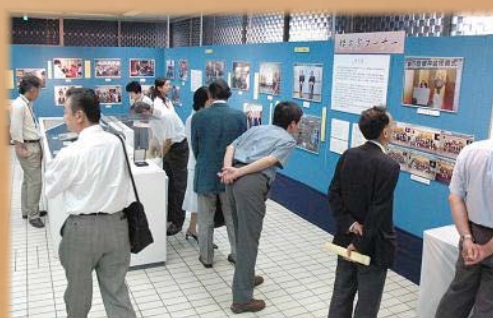
企画展「櫻井徳太郎展」