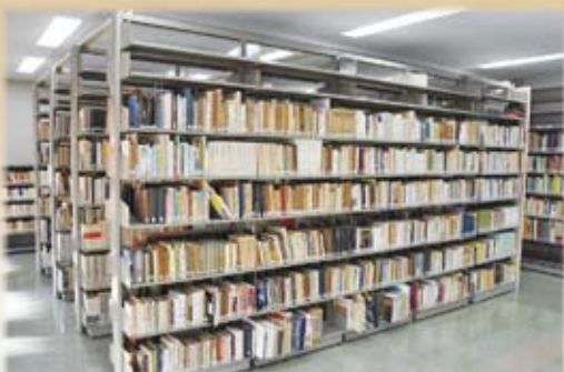
櫻井徳太郎文庫（学術書書庫）