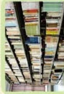
⑥ 櫻井徳太郎文庫 1