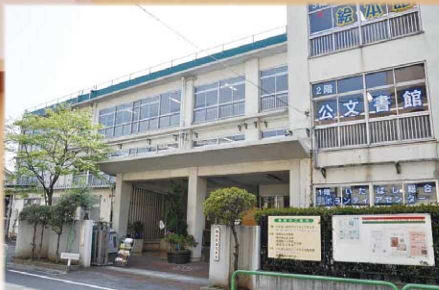
現在の公文書館（旧板橋第三小学校）