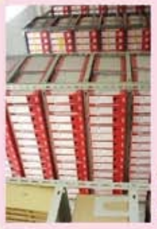
② 第1書庫 公文書をアーカイブボックスで管理。