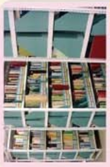
③ 第2書庫 板橋区の刊行物などの資料を保管。