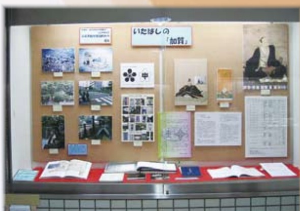
地下展示 (いたばしの「加賀」)