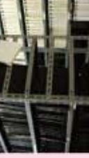
⑤ 第3書庫 板三小・船荷台小 記念室