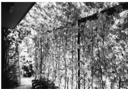
あなたの緑のカーテンをぜひ!

区内の緑のカーテンで収穫されたゴーヤー(3検体)中の放射性物質の検査を実施しました。8月5日の検査結果では、検体すべてについて放射性物質は検出されませんでした。 検査した放射性物質の項目は、セシウム134、セシウム137、ヨウ素131の3物質です。 なお、検体のゴーヤーは、区内3地域の公共施設などの緑のカーテンで育成されたものを採取しました。 問 エコポリスセンター ☎5970-5001 (第3月曜休館)