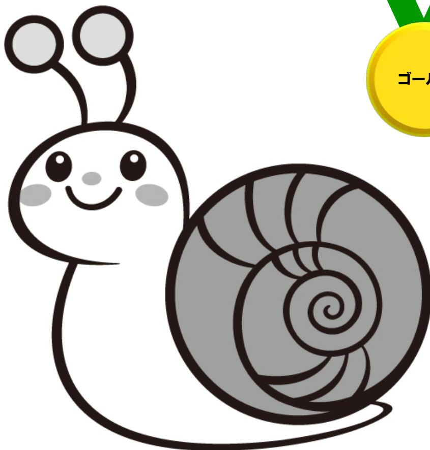
板橋区ごみ減量キャラクター「かたつむりん」