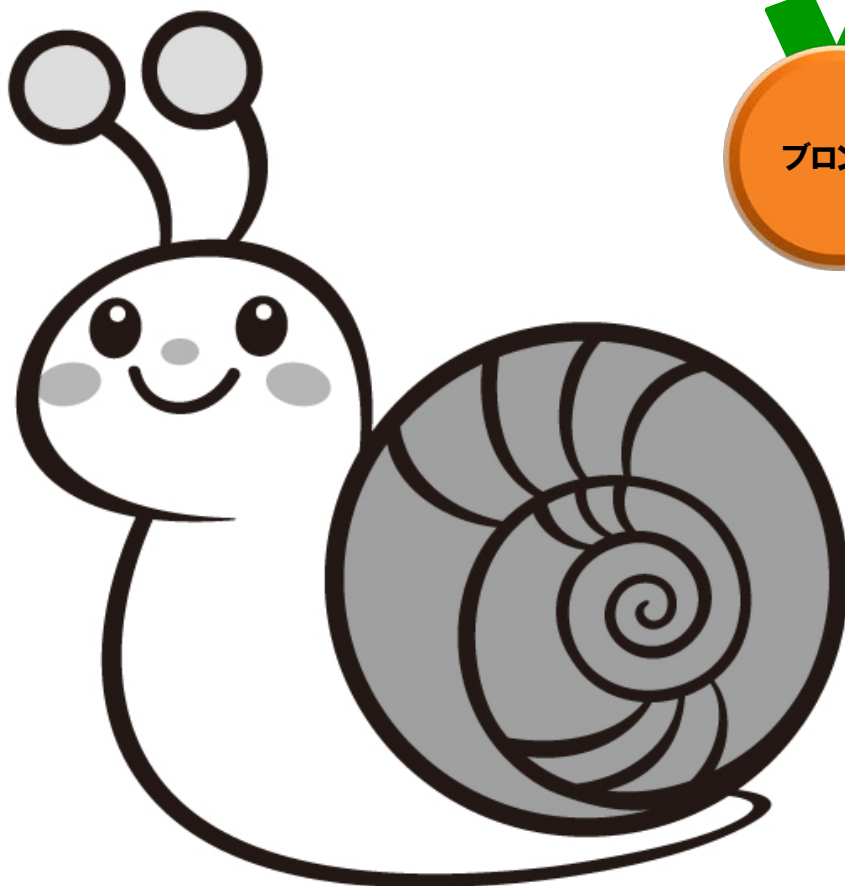
板橋区ごみ減量キャラクター「かたつむりん」