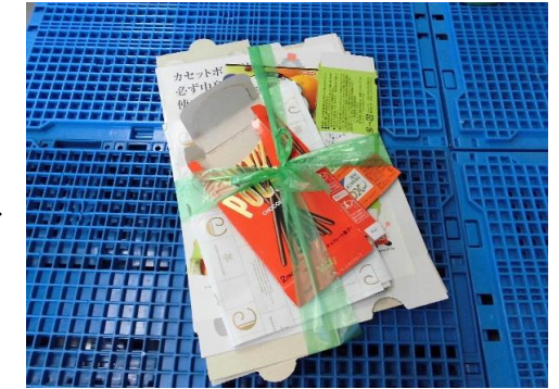
束ねてひもでしばって出す