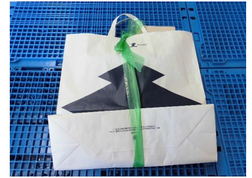
ひもでしばって出す