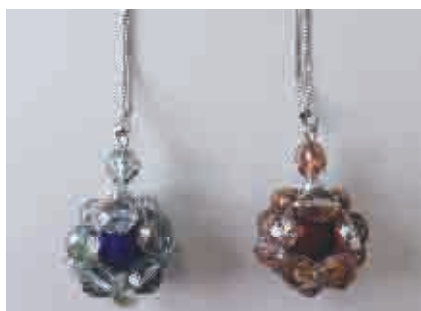
C 香水ビンのペンダント (チェーン付)