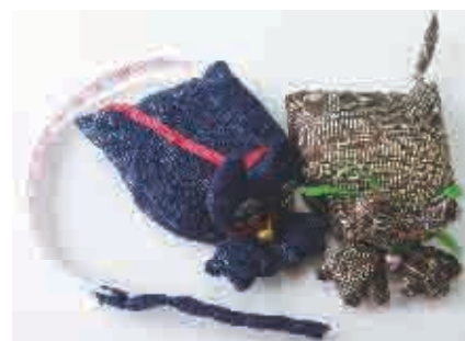
D メジャー付き 子猫ちゃん