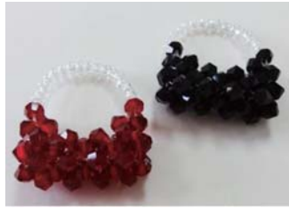
C-① チェーンをつければ ペンダントになる指輪