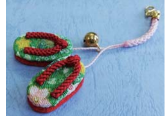
D ストラップ付き草履 (2セット作ります)