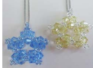
C-② お星さまペンダント (チェーン付)