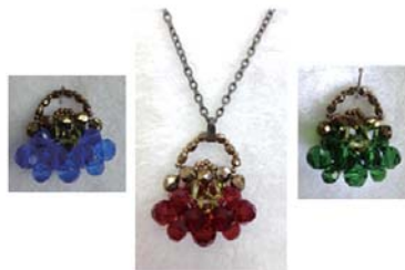
B)ふっくらバックのペンダント