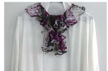
D・E)指あみフリルスカーフ

消費生活展、公開講座に関するお問い合わせは、板橋区消費者センターへ 電話 03(3579)2266