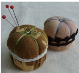
A)ミニミニ・ピンクッション(針刺し)