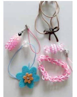
〈手芸体験作品一例〉