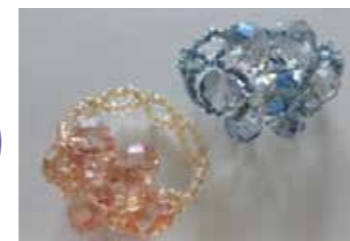
A. フルールリング作り