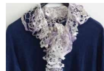
B. 指あみフリルスカーフ作り