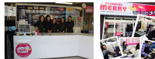
(株)C&L 様々な部門で働きやすい環境づくり！