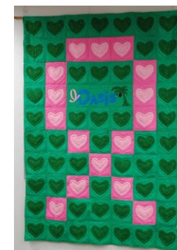
オアシスのシンボル ピンクリボンキルト (平成21年度製作)