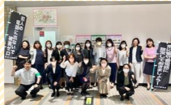
地域とのイベント時の様子