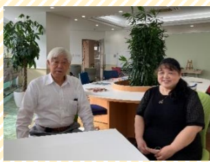
長太郎不動産会長と 支え合い会議メンバー