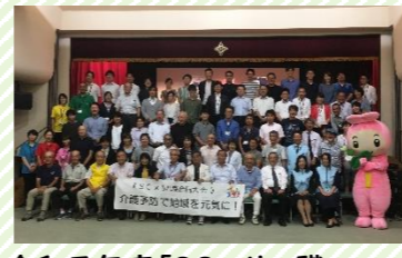
令和元年度「SC×リハ職 合同大会」の様子