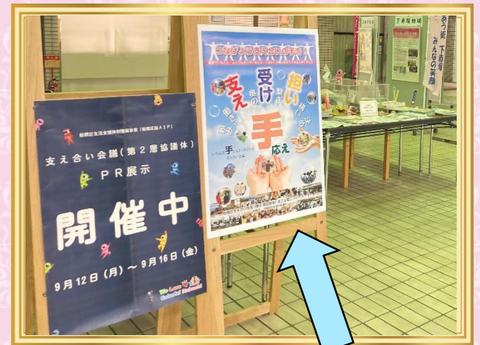
～さわやか福祉財団「いきがい・助け合い サミット in 東京」のポスターセッションで 11位を獲得～