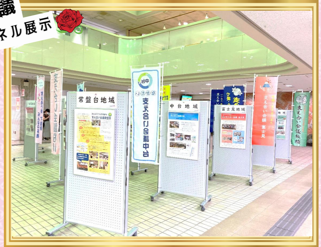
～各地域の特色あふれるパネルやのぼり～

2022年9月12日(月) ～16日(金)の5日間で、 板橋区役所1階イベント スクエアにて、18地域の 各支え合い会議の活動紹介 パネル展示を実施しました。