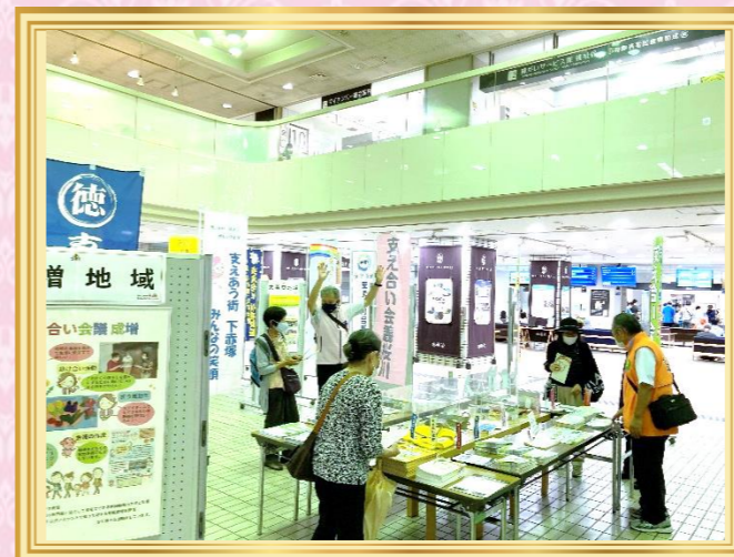
～各地域の発行物をPR～