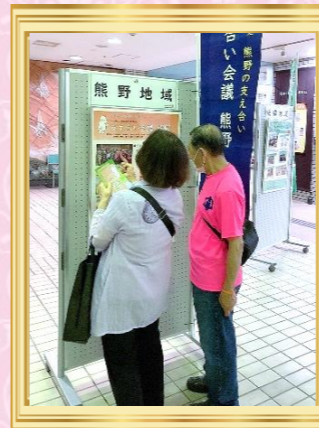
～支え合い会議メンバーとともに、 区民の皆様へPR～