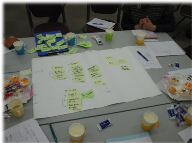
▲アンケート調査の項目について検討中