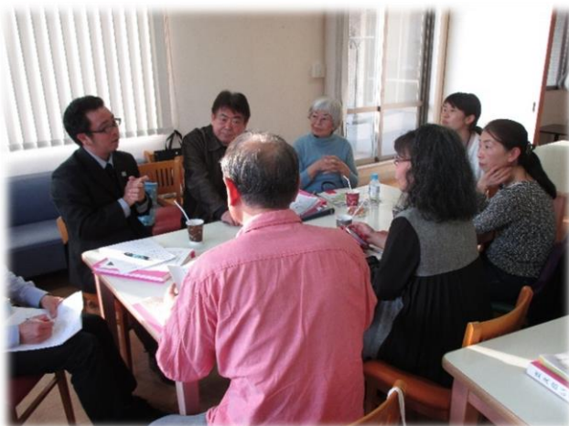
▲テーマ毎の話し合いの様子