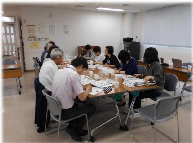
▲小グループで情報共有&検討