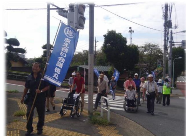
▲第2回徳丸を歩こう会（H30.9月実施）