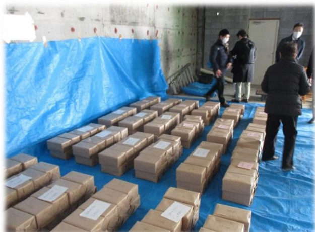
▲シニアガイドの配布