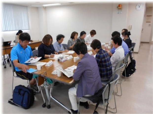
▲小グループで情報共有&検討