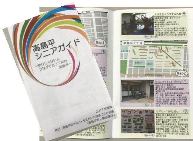
▲地域情報をまとめた「シニアガイドブック」