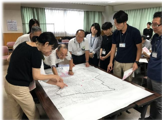
▲各地域活動の把握