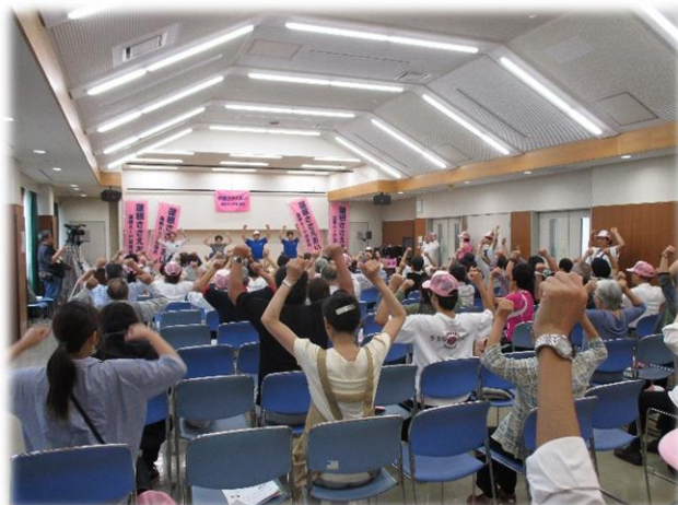
▲蓮根ささえあいの集い（H30.9）