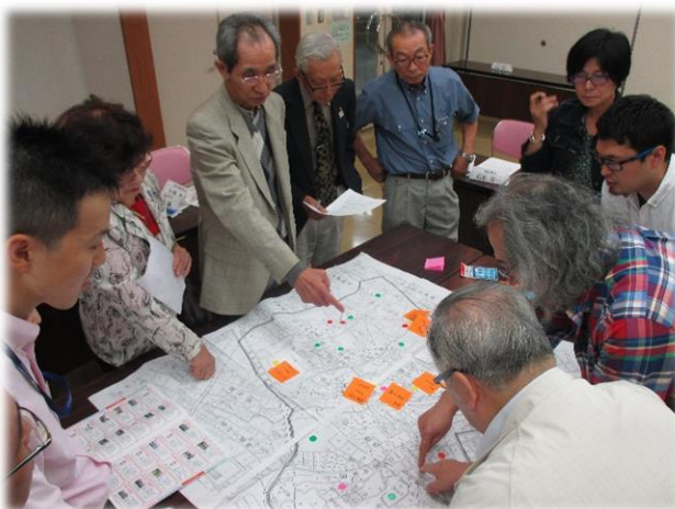
▲地域資源の情報共有