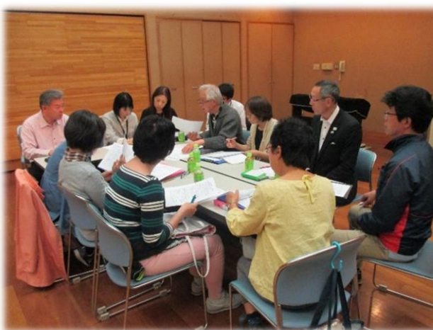
▲テーマ毎の話し合いの様子