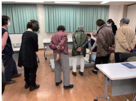
マットレスや枕を実際に触って寝心地を体験！