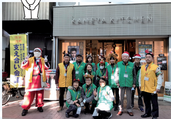
2022年12月 健康チェックのスポット活動