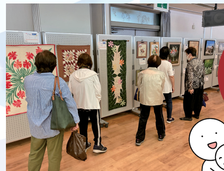
2023年6月 じまん展開催