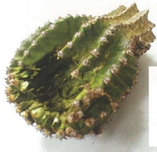
サボテン (中がくりぬかれていました。)