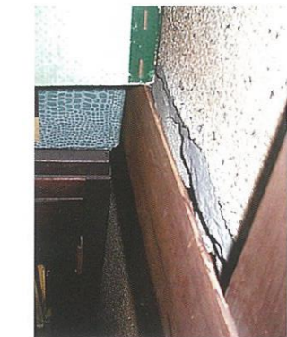
長押(なげし)のすきま(壁がしっかりできていません。)