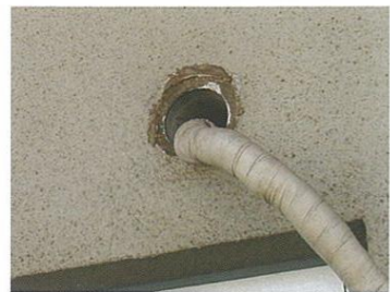
パッキンの取れた配管貫通部