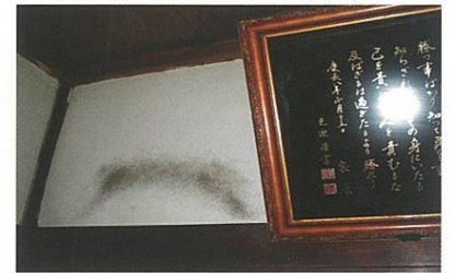
額縁の裏で見付かったラットサイン