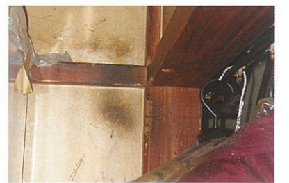
頻繁に通るところにラットサインができる。