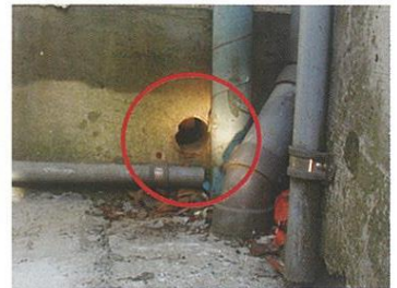
使用していない開口部