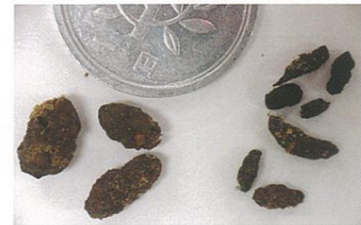
糞を1円玉と比べてみると... (左はドブネズミ、右はクマネズミ)