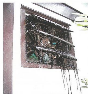
換気扇のシャッターが油汚れで閉じなくなった例