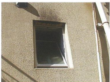
網戸のない換気窓