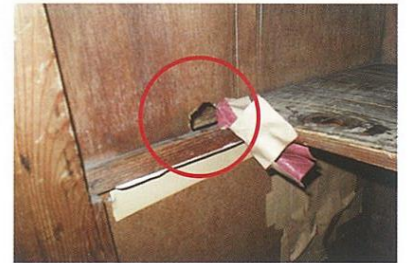
押入れを片付けたら、穴が見つかりました。