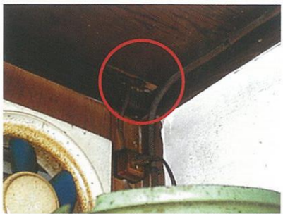
電気コードを通した穴をかじって通り道にしていた例

ネズミがよく通るところには、体脂などの汚れが付着して黒ずんだ「ラットサイン」があります。ラットサインや走る音、ネズミの糞を手がかりにして探しましょう。