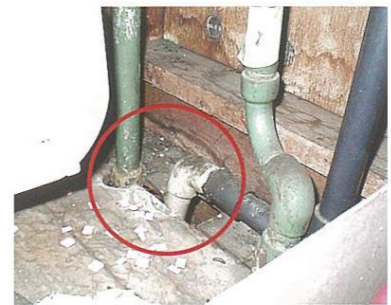
メーターボックス内の配管貫通部