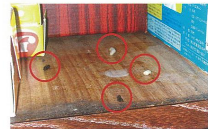
食器棚の上で見付かったクマネズミの糞