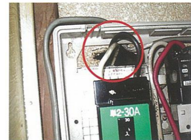
配電盤の配線周りの穴