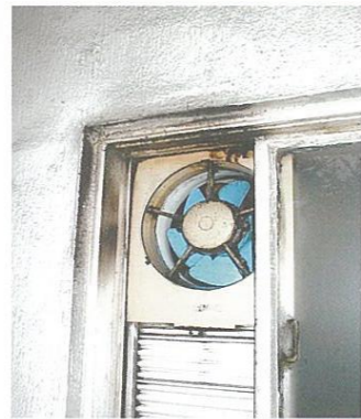
窓付け換気扇(止まっていれば、穴同然。)