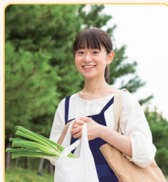
生活用品の 買い物