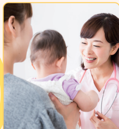
健診や買い物等の 外出同行