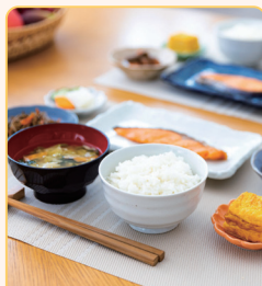
食事の支度 片付け

水回りがとってもきれいになりました！ また、ヘルパーさんがいつも優しく話しかけてくれるのが嬉しいです。 普段大人と話す機会が無いので、自分の心のリフレッシュにもなります。