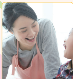
きょうだいのお世話