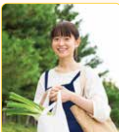
生活用品の 買い物