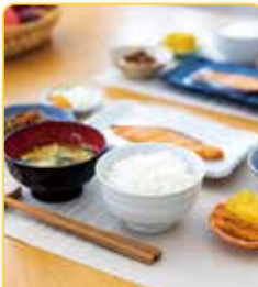
食事の支度 片付け

水回りがとってもきれいになりました！ また、ヘルパーさんがいつも優しく話しかけてくれるのが嬉しいです。 普段大人と話す機会が無いので、自分の心のリフレッシュにもなります。