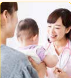
健診や買い物等の 外出同行

利用時に、二次元コード決済（PayPay）払いまたは、 後日、請求書・クレジットカード払い