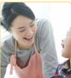
きょうだいのお世話