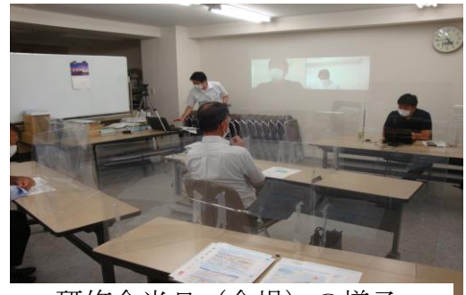
研修会当日（会場）の様子