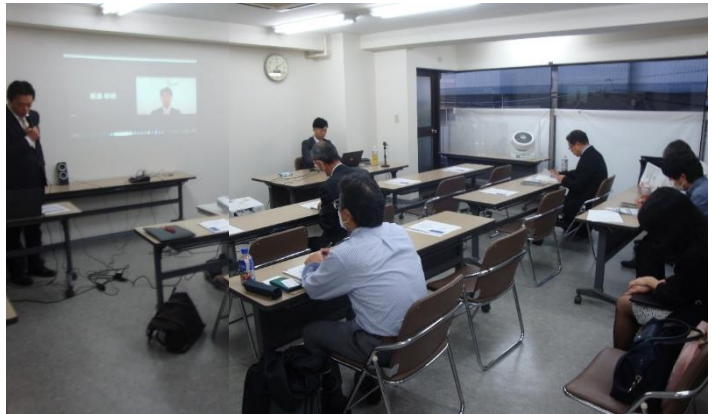
研修会当日(会場)の様子

また、今回の研修会参加者からの質問やアンケート結果を基に「事業所に関わる環境法令(応用編)」としての研修会開催も予定しておりますので、多くの皆様のご参加お待ちしております。