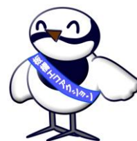
環境政策課のマスコット ハクセキレイの「ハクちゃん」です。