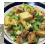
▲ゴーヤーチャンプル