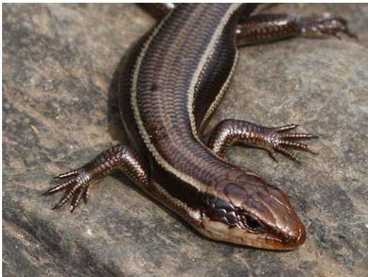
ヒガシニホントカゲ