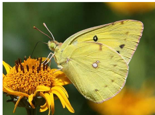
モンキチョウ はねに白いもようがある。