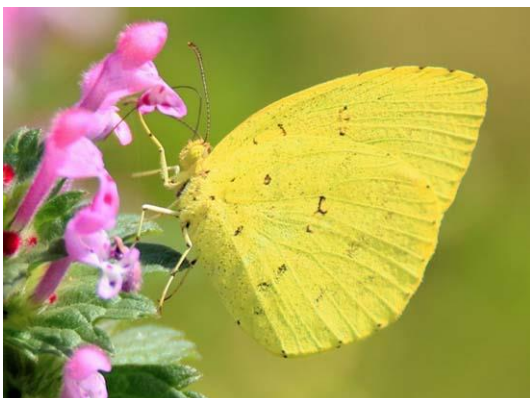
キタキチョウ はねに白いもようはない。