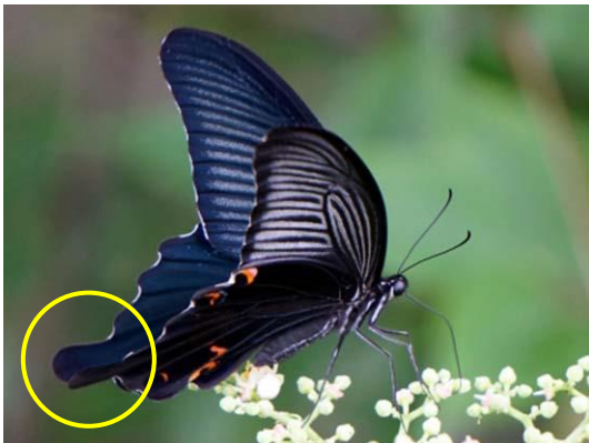
クロアゲハ 後ろばね とっき に突起がある。