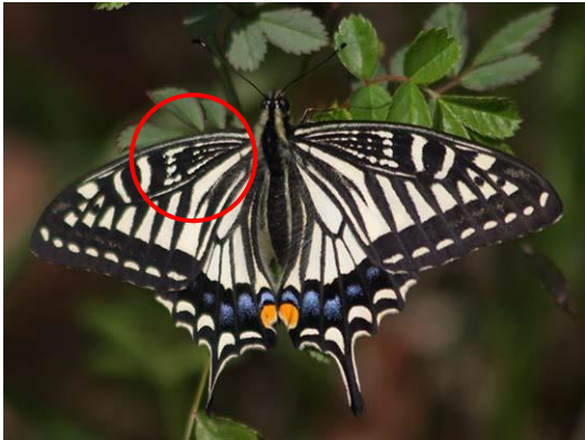
アゲハ (ナミアゲハ) 前ばねの付け根 ね のもようは黒い線。

ちょうさ 調査ガイドにのっている生きものの、しめるい にている種類との見分け方です。