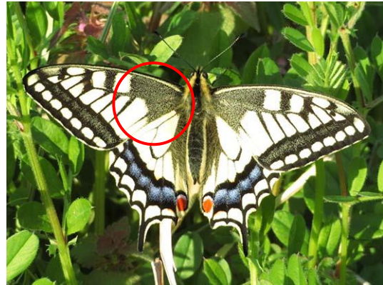
キアゲハ 前ばねの付け根 ね のもように黒い線がない。