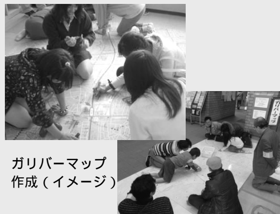
ガリバーマップ 作成(イメージ)

大きな地図を使って若木周辺地区の様子を皆さんと確認します (ガリバーマップの作成)