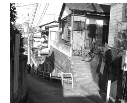
若木周辺地区の住宅地