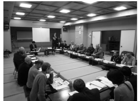
▲第1回準備会の様子