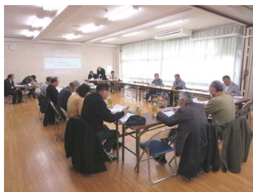
まちづくり協議会の様子