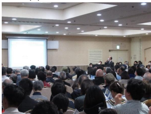
○説明会の様子(1日目)