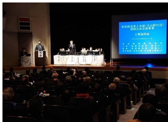
○説明会の様子(2日目)

※当日の資料動画及び質疑応答は、下記のURLまたは二次元コードからご覧いただけます。