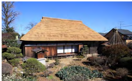
旧粕谷家（東の隠居）住宅

このことから、当該建造物は、板橋崖線軸地区とその周辺の良好な景観形成に寄与する重要な存在であることから、その土地を含め、良好な維持・管理に努めます。