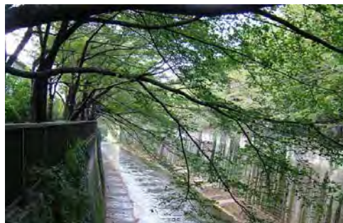
石神井川の桜並木

また、占用許可にあたっては、工作物等は緑や沿道の建築物との調和に配慮した形態・意匠とし、緑と調和した落ち着いた色彩とするよう、配慮します。