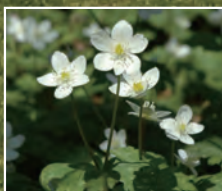
区の花「ニリンソウ」