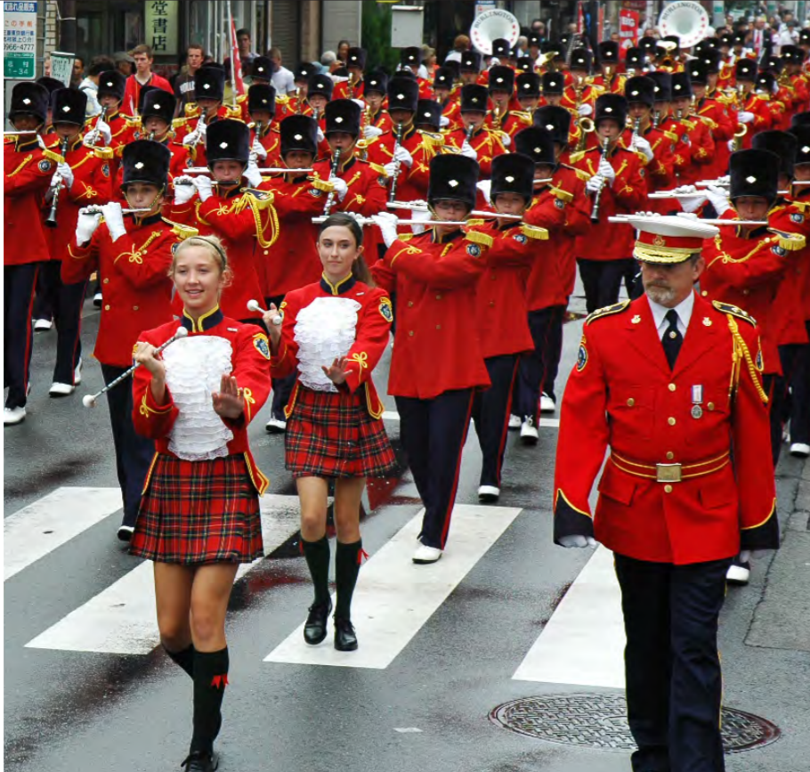
姉妹都市提携20周年記念として平成21年8月2日、カナダ最大級のマーチングバンドが志村銀座商店街で迫力のパレードを披露