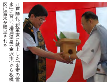
江戸時代、將軍家に献上した氷室の雪水に習い、湯涌温泉(金沢市)から板橋区に雪水が贈呈された

日光市には「板橋の森」という森があります。この森は、昭和58年6月に締結された「みどりと文化の交流協定」の10周年を記念して誕生しました。平成23年10月には、日光市産の「木材の使用と環境教育」についての「覚書」を締結しており、緑を愛し文化を大切にする心を通わせる交流を行っています。