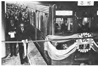
昭和43年／都営地下鉄6号線が開通