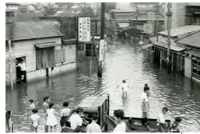
昭和33年／台風22号による被害(現本町)