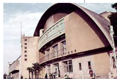
昭和30年／区民会館落成