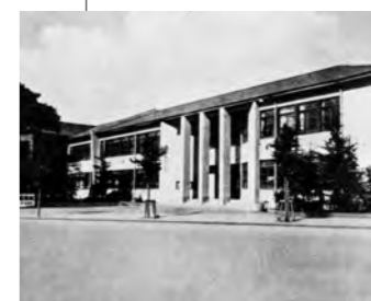
昭和17年／板橋区役所新庁舎が落成