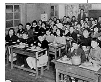
昭和25年／当時の給食の風景