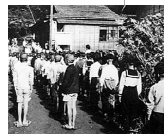
昭和19年／集団疎開の様子