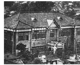
昭和7年／当時の区役所庁舎