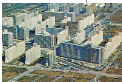
昭和44年／高島平団地の建設