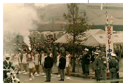
昭和39年／東京オリンピック聖火が板橋区を通過