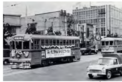
昭和41年／さよなら都電志村線