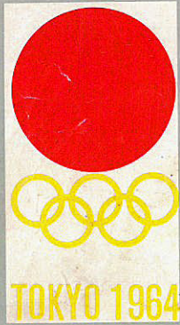
オリンピック東京大会マーク旗