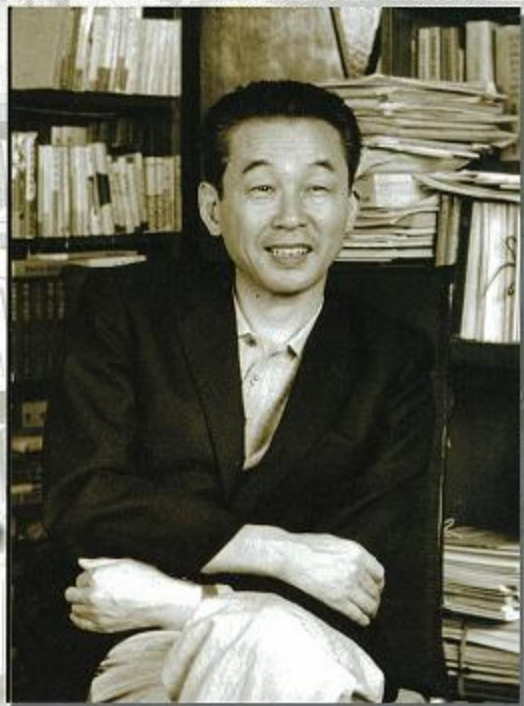
書斎で記者の質問に答える