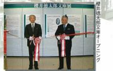
櫻井徳太郎文庫オープニング