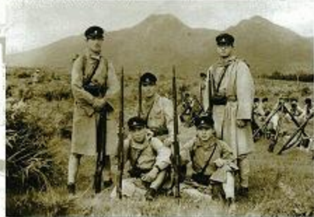
師範学校当時軍事教練に参加 (前列右から1番目)