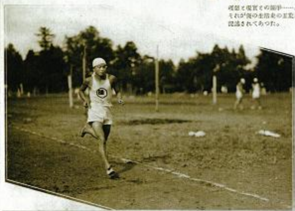
新潟県高田師範学校 卒業アルバムの一コマ