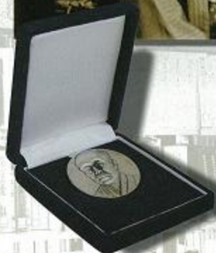
第1回 柳田賞受賞メダル