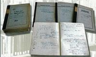
調査活動を詳細に書きつづつたフィールドノート