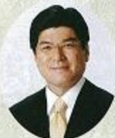
板橋区長 坂本 健

櫻井徳太郎先生は、第1回柳田國男賞及び第12回南方熊楠賞を受賞された日本民俗学の大家であり、日本宗教史の権威でもあります。