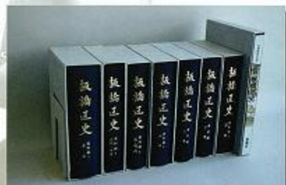
区史編さん調査会会長として監修した板橋区史(全8巻)