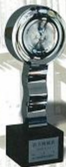
第12回 南方熊楠賞受賞記念トロフィー