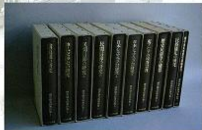
櫻井民俗の集大成 櫻井徳太郎著作集(全10巻、吉川弘文館)