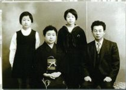
家族の記念撮影(高田女子中学入学に際し)