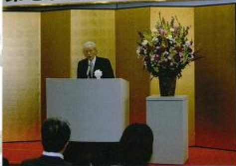
櫻井賞授賞式での先生の講演