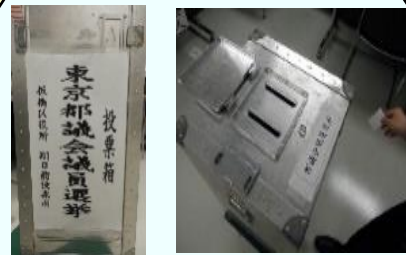
※投票箱正面、真上拡大図