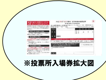
※投票所入場券拡大図