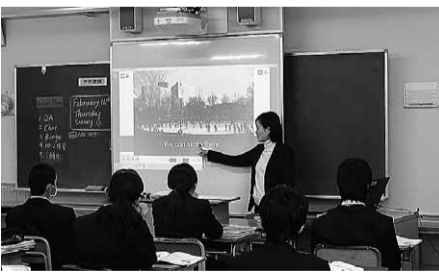
区内中学校の授業の様子

【質 問】①各種施策を展開し解消に取り組む。②政策決定部門において女性職員の能力を活用できるよう配慮する。 ワンルームマンション建設の規制を求めて 【質 問】大規模なワンルームマンション建設ができないよう規制を求めるが、見解は。 区長 建設の際は家族向け住戸も設置するなど、既存の条例を30年度中に改正し、良好なまちづくりを進める。※以上のほか、在宅生活を支える医療・介護、板橋区ホテル生環境問題、若者の社会参画、地域課題について質問があった