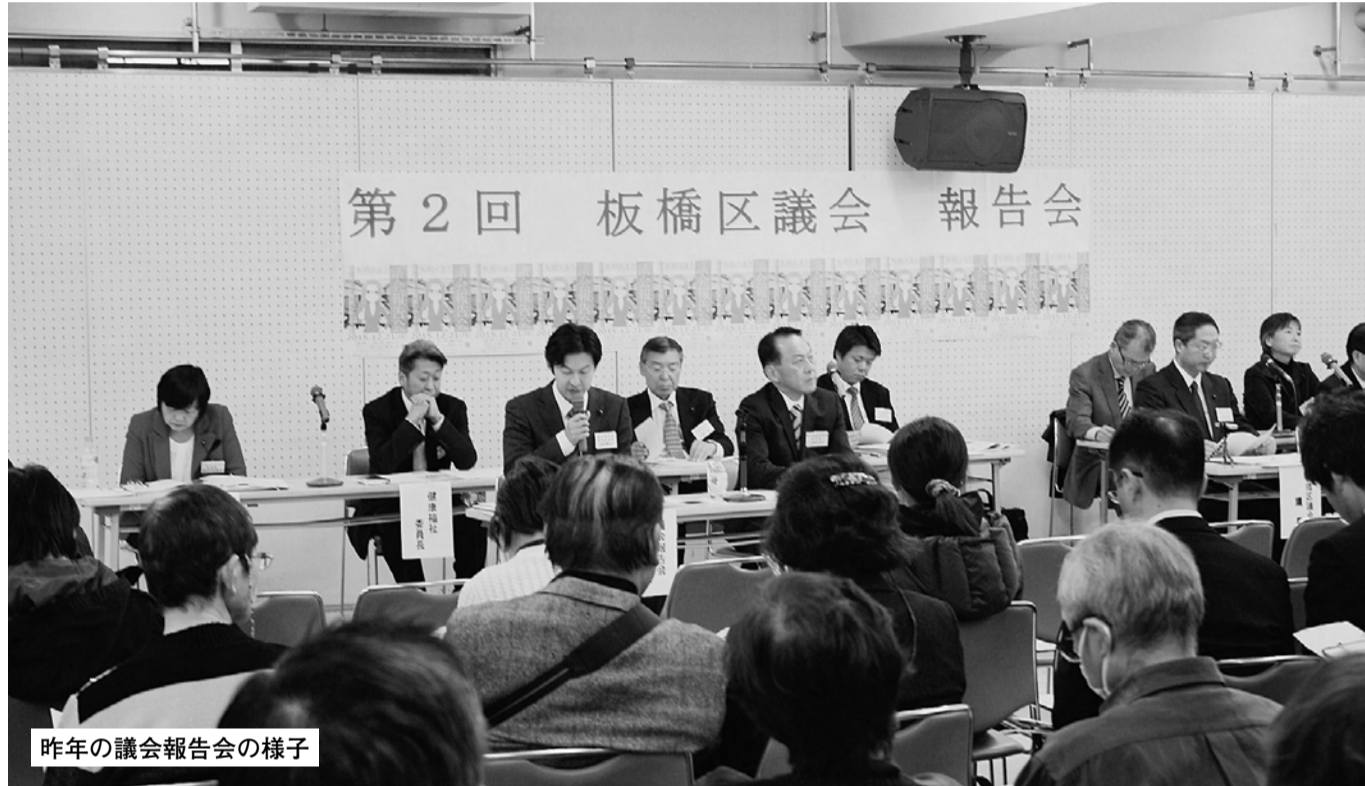
昨年の議会報告会の様子