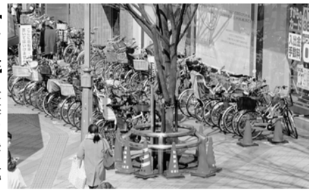
成増駅前前の放置自転車

【質問】①国内法には障害者差別の規定がなく、何が差別を示されていないため、差別に対する認識に差が生じている。区長は、障害者に対する差別がどのようなものであると認識しているか。②障害者が65歳に到達すると、障害者福祉サービスから介護保険制度に移行される。それまでの支援が受けられないなど新たな負担を強いられるため、中には是正すべき。これは障害者差別解消法の理念に反する。③各分野での差別を明確にし、ハード・ソフト両面を正しく進めるため、実施計画の策定を求めるが、区長の見解を。 【区長】①障がい理由に不利な取扱いをしたり、雇用機会が十分でない、差別となる場合があると認識している。②介護保険に移行すると、自己負担無料のサービスが1割負担となる点は課題。国は、自己負担分の低所得で発生した自己負担分を、低所得の障がい者が対象に障害者総合支援法上の制度で支給できるように検討していきたい。今後の国の動向を注視していきたい。