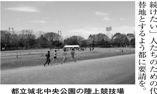
都立城北中央公園の陸上競技場

【区長】①公認陸上競技場が整備できれば、公認競技会などが開催でき、まちにぎわいにもつながる。先日、都知事との意見交換の場でも要望を行ったが、今後とも都の意向を注視し、様々な機会を捉え働きかける。②公園周辺には公共交通サービス水準の低い地域があり、コミュニティバス導入の可能性について検討中。市街地再開発事業により上板橋駅南口の駅前広場などの整備が完了すれば、運行計画上天きな進展になる。陸上競技場の整備やまちづくりの状況を見きわめながら、引き続き調査検討する。③都に対し、都市計画面上板橋公園事業の区域内に代替地を求めることは、難しいと考えたが、住み慣れたまちを離れたいという住民への配慮や対策について、引き続き要望していく。 ※以上のほか、野口研究所・理化学研究所の跡地活用・廃止施設の新築と公共施設の再編整備、地域包括ケアシステム、スポーツ振興、防災対策について質問があった