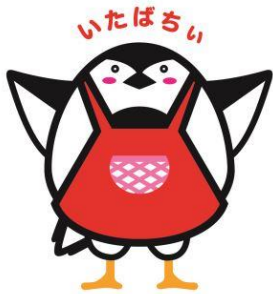
いたばし くしょく 板橋区食育キャラクター