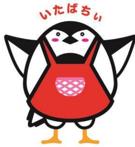
板橋区食育キャラクター いたばち