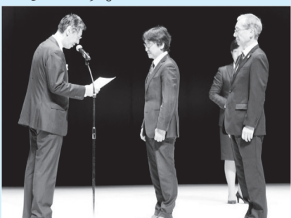
11月9日表彰式の様子

学校情報化先進校は、学校情報化優良校として認定された学校のうち、特に優れた取組を行っている学校について、書類審査・現地訪問による審査などを経て決定するものです。毎年、表彰されるのは全国で2～3校のみという、大変ハードルの高いものです。