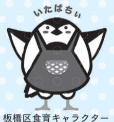
板橋区食育キャラクター

区民の皆様には学校給食の魅力を知っていただくための展示などを行います。ぜひ、お越しください。