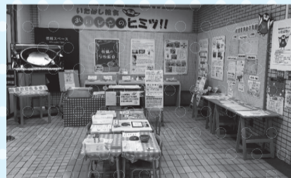
昨年度展示の様子