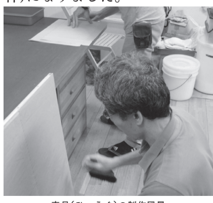
表具(ひょうぐ)の制作風景

3月29日に新たに3件の文化財の登録を決定し、告示しました。これにより、区の登録文化財は181件(うち指定文化財34件)になりました。