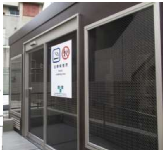
コンテナイメージ図