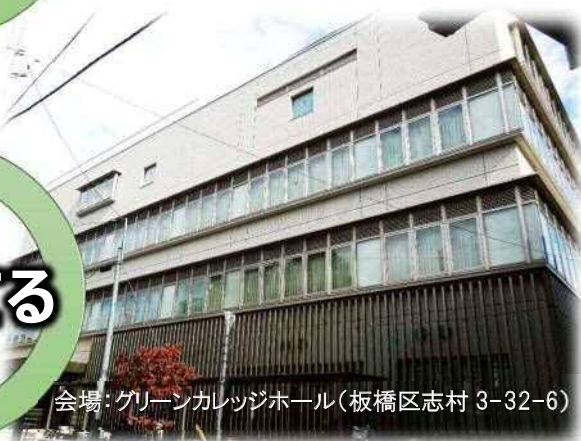
会場: グリーンカレッジホール(板橋区志村 3-32-6)