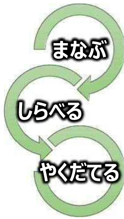
板橋グリーンカレッジ体系図