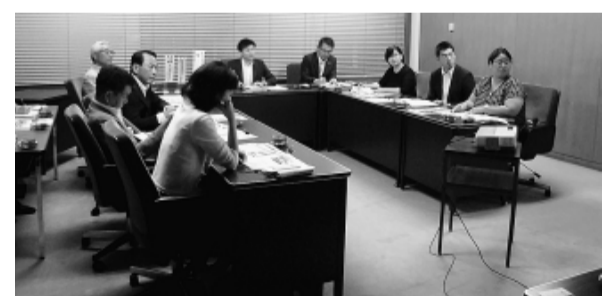
バスを軸とした公共交通への取組みについて説明を受ける委員

都市建設委員会 岐阜県各務原市(8月19日) 借主負担DIY型契約による空き家リノベーション事業について説明を受け、各委員からは岐阜女子大学や金融機関との連携内容などについて質問がありました。 岐阜県岐阜市(8月20日) バスを軸とした公共交通への取組みについて説明を受け、各委員からはコミュニティバス導入の経緯、運行ルートや運賃の決定方法などについて質問がありました。