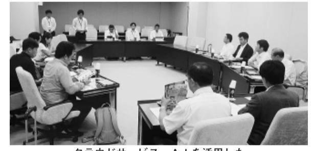
クラウドサービス・AIを活用した業務改善について説明を受ける委員

企画総務委員会 熊本県熊本市(8月20日) クラウドサービス・AIを活用した業務改善について説明を受け、各委員からはチャットボットの活用による市民サービス向上の具体例などについて質問がありました。 熊本県宇城市(8月21日) RPA(業務プロセス自動化技術)を活用した業務効率化などについて説明を受け、各委員からは職員の負担軽減や費用対効果を上げる工夫などについて質問がありました。