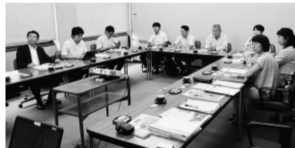
市民との協働によるクリーン作戦について説明を受ける委員

区民環境委員会 福岡県久留米市(8月21日) 文化交流施設「久留米シティプラザ」の取組みについて説明を受け、各委員からは運営方法やスタッフの育成計画、ホールの稼働率などについて質問がありました。 福岡県筑後市(8月22日) 市民との協働によるクリーン作戦について説明を受け、各委員からは市民の参加率や周知方法、不法投棄の減少など事業による効果などについて質問がありました。