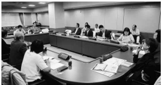
在宅介護総合特区について説明を受ける委員

健康福祉委員会 岡山県岡山市(8月20日) 在宅介護総合特区について説明を受け、各委員からは国や県による財政支援や、介護事業所によるサービスの質を向上させる取組みなどについて質問がありました。 大阪府大阪市(8月21日) 認知症施策について説明を受け、各委員からは緊急ショートステイ事業の利用状況や、社会福祉協議会との連携などについて質問がありました。