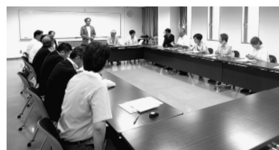
名古屋科学館について説明を受ける委員

文教児童委員会 三重県名張市(8月20日) 子ども支援センターかがやきについて説明を受け、各委員からは地域の子育て支援に係る人材育成や情報共有などについて質問がありました。 愛知県名古屋科学館(8月21日) 世界最大のプラネタリウムを備える名古屋科学館について説明を受け、各委員からは学芸員の人材育成や、関係機関との連携・人事交流などについて質問がありました。