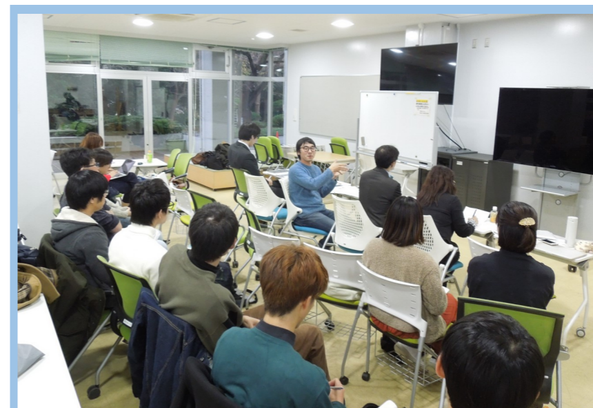
千葉大学松戸キャンパスでの発表会の様子